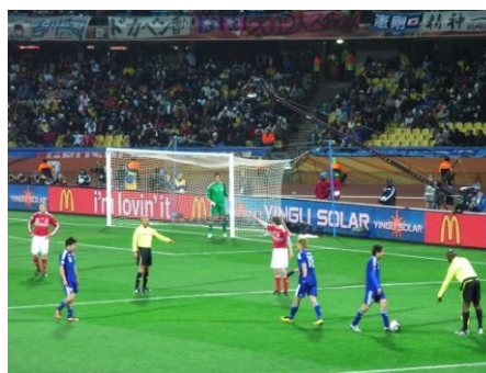
〔 日本代表の決勝トーナメントを決めたデンマーク戦の様相 〕