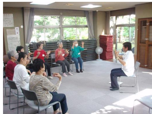
家でもできる簡単な体操。 無理をしないのが続ける秘訣。