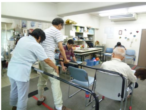
機能訓練に特化した通所介護。 個々のプログラムに基づいて指導します。

そして2000年の介護保険制度創設にむけて、介護支援専門員（ケアマネジャー）の資格制度が始まることを知り、猛勉強の末、1999年にケアマネジャー1期生として資格を取得。本格的に介護事業への参入を決め、その後、通所介護の事業所もスタートさせました。通所介護とは、一般的に日帰りの介護施設で、入浴や食事、機能訓練などのサービスを行っていますが、入浴と食事のサービスをなくし、 機能訓練に特化した新しいスタイルの通所介護 です。このスタイルですと、鍼灸治療院を少し拡張し、バリアフリーに改装する程度で対応できるため、介護事