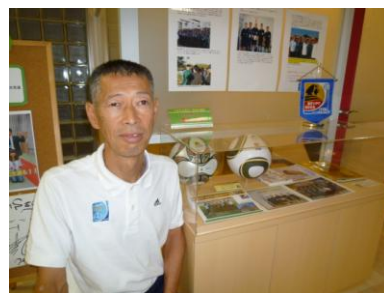
学校の入り口にはワールドカップ時のレポートやグッズが展示されている