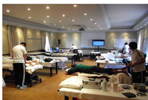
〔 (上)スペイン VS オランダの決勝戦を担当した審判団と。(左から3番目が私) (下)ベッドが8台並んだトリートメントルームは常に満員。 〕